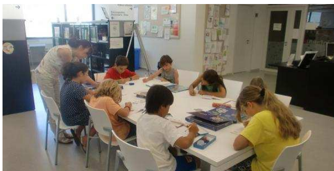
Imatge Club d'estiu 2012

Per quart any consecutiu, les places del Club d'estiu estan esgotades.