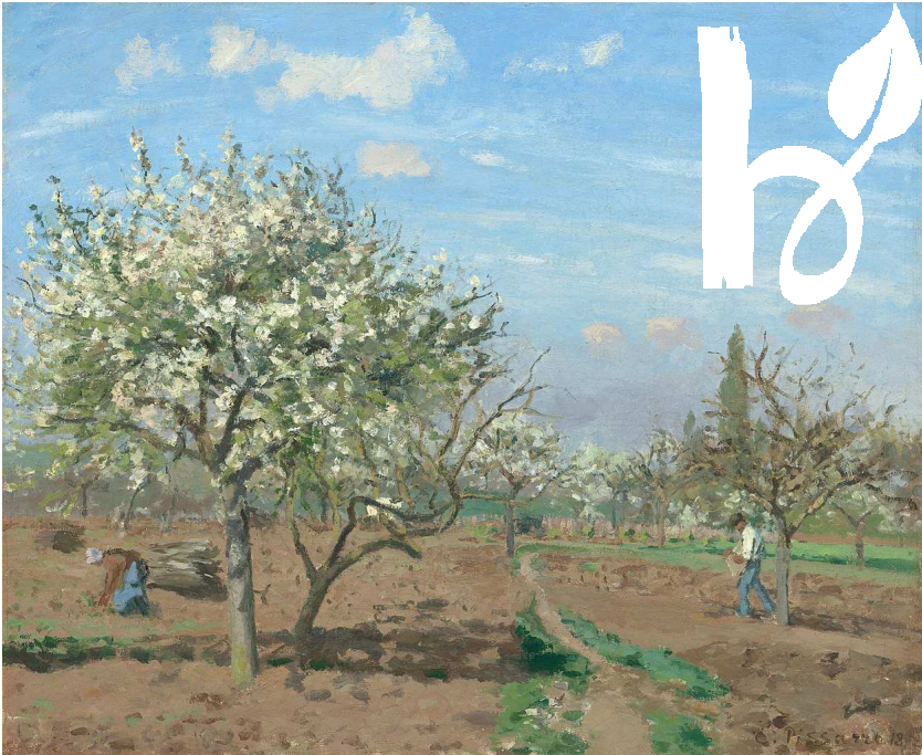
Camille Pissarro, Le verger, 1872